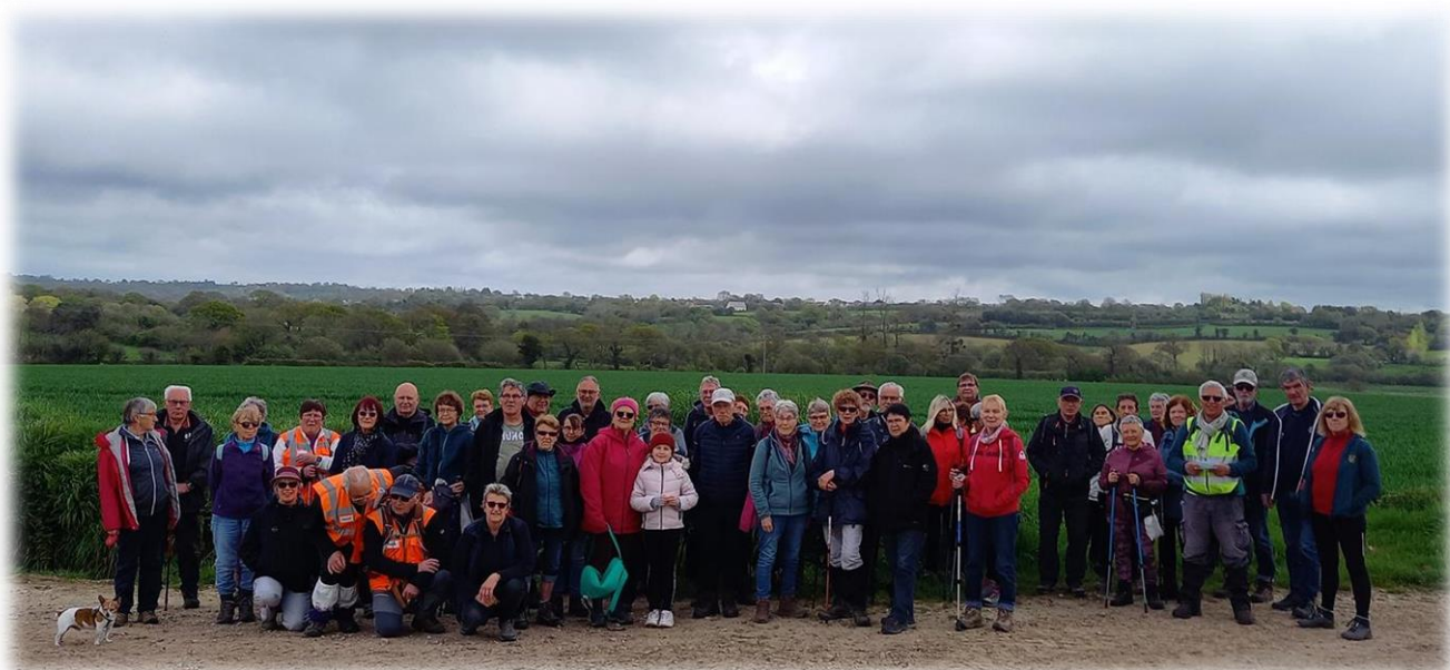
58 participants, pour un 1 er mai c'est pas mal ! Au départ, ciel un peu couvert, mais les éclaircies ensoleillées ne vont pas tarder.