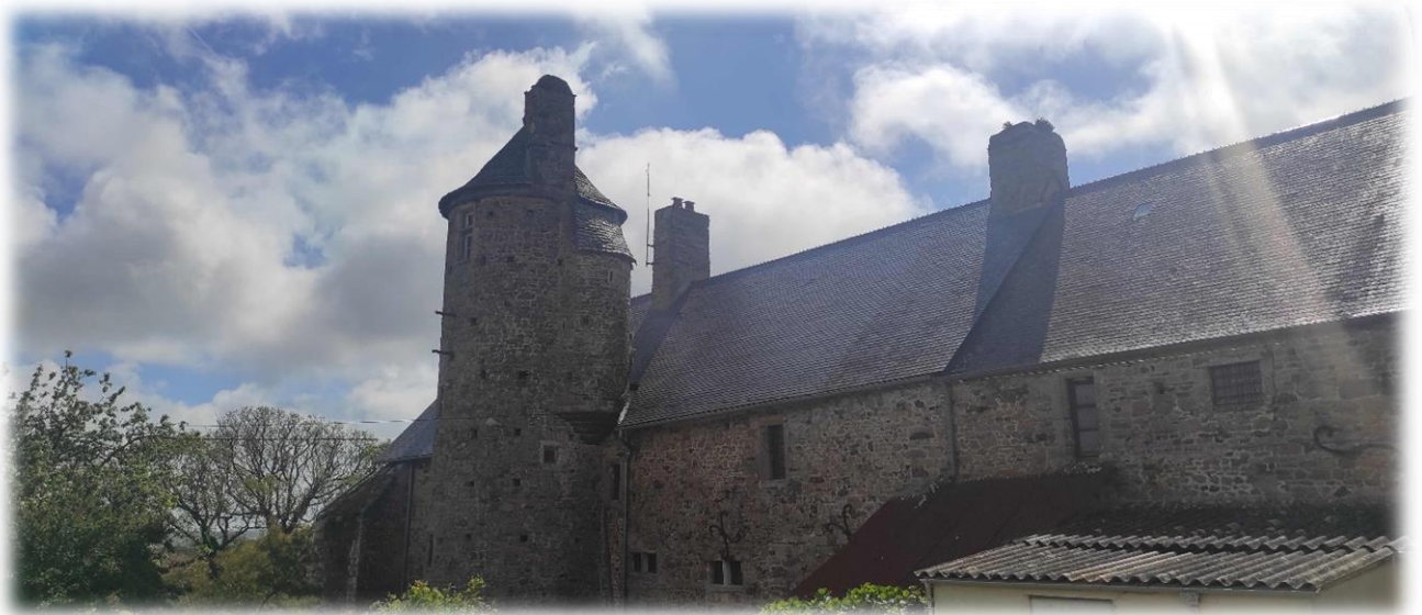
Façade arrière du manoir de Lanquetot (Le Vrétot)