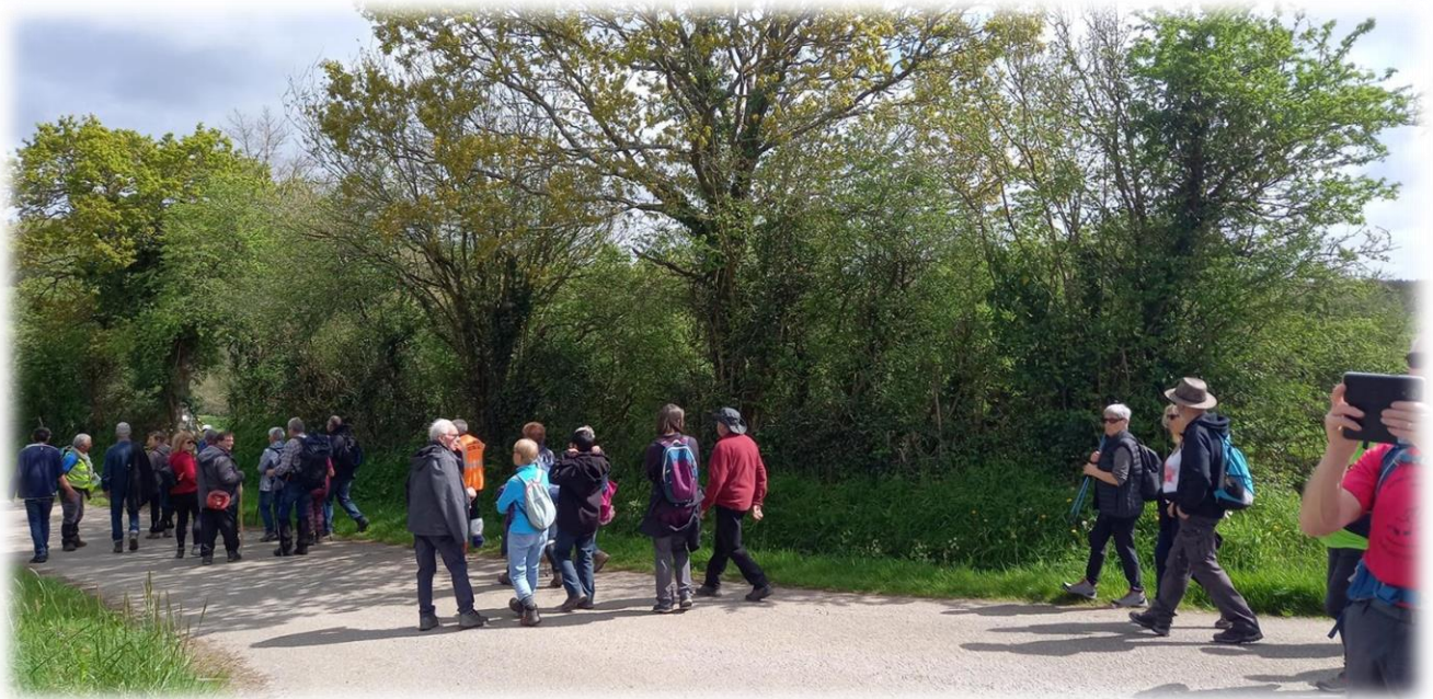
et le groupe long parcours de l'autre.