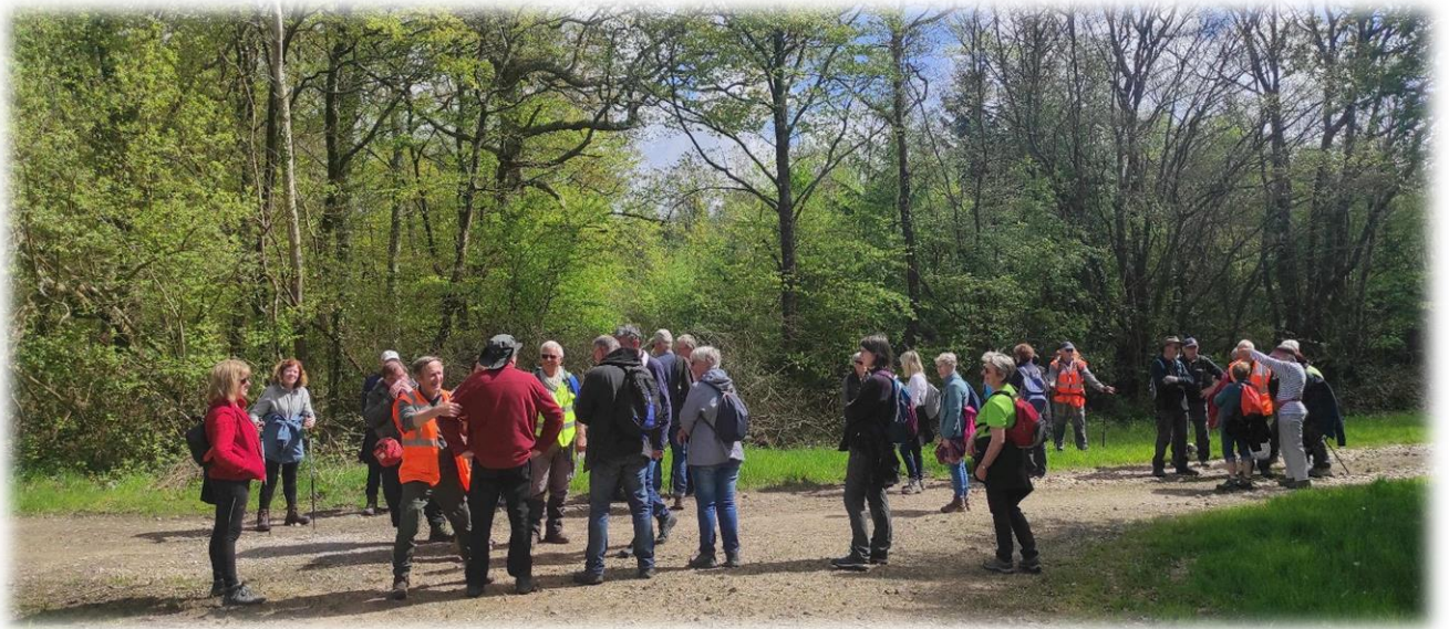
C'est le printemps, la nature se réveille !