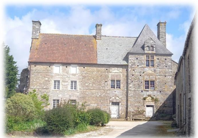
Manoir Saint-Marcouf (Pierreville)

Ce manoir de Saint-Marcouf (XVII e ) fut la propriété de la famille de l'amiral de Tourville en 1639, ce fameux amiral Constantin de Tourville, Anne Hilarion de Coctentin (1642-1701) qui, en 1692, dirige une flotte de 44 navires contre le double de vaisseaux anglo-hollandais lors de la victoire de la bataille de Barfleur, suivie de la défaite de la Hougue.