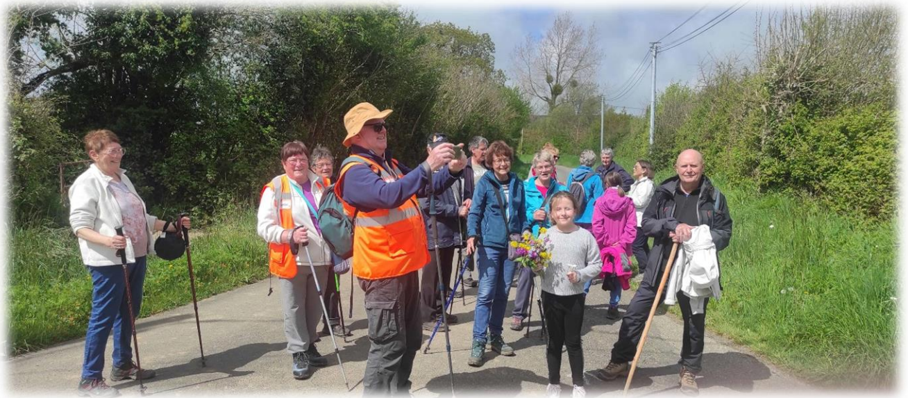
C'est la séparation, le groupe raccourci d'un côté,