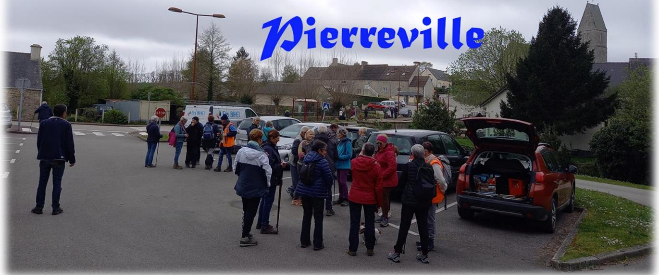
Rendez-vous dans le bourg... et parkings annexes